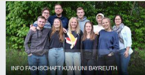
INFO FACHSCHAFT KUWI UNI BAYREUTH